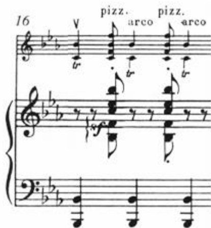
Прикл.3. Сюїта для скрипки і фортепіано на теми Перголезі, 1925 р., Серенада, т.16