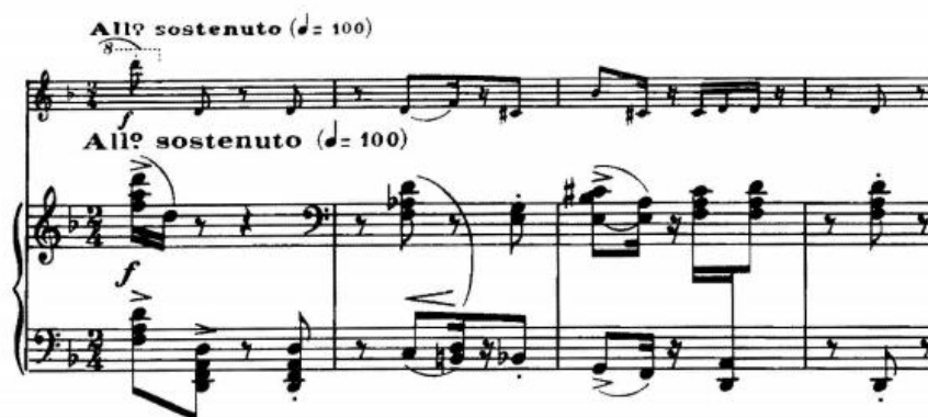
Прикл.13. «Дивертисмент», сюїта для скрипки з фортепіано, ч. I, Allegro sostenuto

Коли нюанс спадає на mp , матеріал переходить на струну E . – у високий регістр, де ліги перемежаються із загостреними нотами (в партитурі цей матеріал виписаний в одному регістрі). Завдяки штриховій техніці скрипалю вдається відтворити щонайменше характер звуковидобування інструментів оркестру.