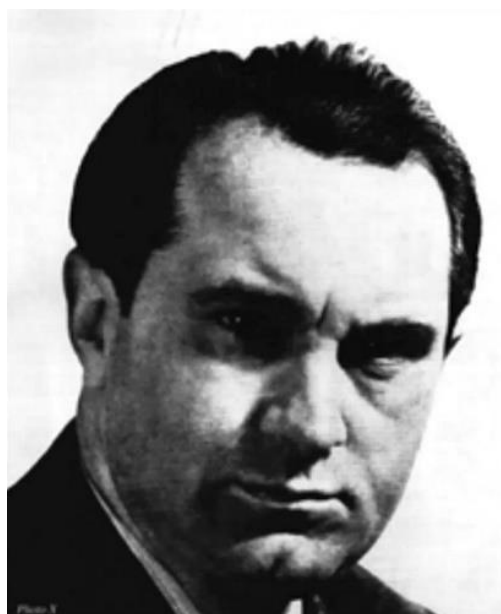
Ежен Боцца (1905 – 1991)