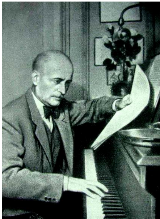
Жак Ібер (1890 – 1962)