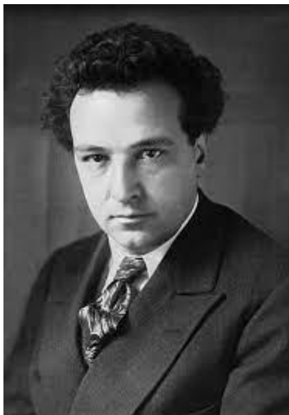
Артюр Онеггер (1892 – 1955)