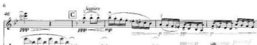
Приклад 13. В. Сильвестров. Пост скрипtum. Соната для скрипки і фортепіано. Перша частина. Тематичний комплекс Allegro

Другий тематичний комплекс, Allegro, задіює активний рух, гамоподібні пасажі шістнадцятими, альбертієві басы.