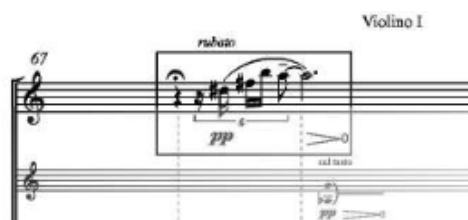
Приклад 1. Гра за заданою графічною моделлю (В. Сильвестров. Квартет №1 (1974))

Квартет №1 (1974). Його можна охарактеризувати як твір, що стоїть на порозі між авангардом і пост-авангардом, і через це його музична значущість і його перспективи настільки переконливі, що цей твір навіть можна зарахувати до кращих квартетів 20 століття. Перше виконання твору відбулося у Великій Британії у 2006 році, (October 2006 London (United Kingdom), Purcell Room), друге – у 2007 у Німеччині (September 2007 München (Germany), Allerheiligen Hofkirche), і третє Швейцарії у 2016 році (August 2016 Davos (Switzerland), Kirche St. Johann). Це одночастинний твір, Andante , в якому автор використовує як класичну звуковисотну модель запису, так і елементи алеаторики (гра за заданої графічною моделлю, повторення ритмічного паттерну у рамці, гра поза підставкою тощо).