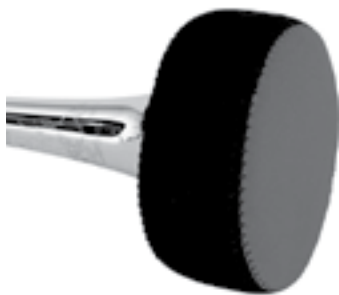
Ілюстрація 17. Сурдина з неопрену

демонструє постійну присутність цього пристрою, спочатку в обрядово-релігійних та військових діях, а згодом і в мистецькому середовищі. Історично першими, за збереженими свідоцтвами, були сурдини для труб, пізніше практика їх застосування поступово поширилась на тромбони, валторни, туби.