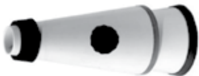
Ілюстрація 13. «Solotone mute»