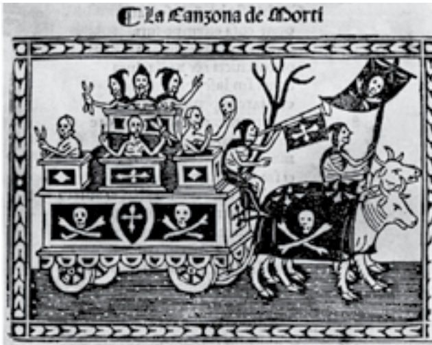
Ілюстрація 2. La Canzona de' Morti , гравюра на дереві, Центральна національна бібліотека Флоренції 8

[ gedempten drompten ], і його син Генсле з лютнею дискантувати, і нас троє з лютнею тенорувати, на імена Пітер Марпург, Генн Каммерер і я, Бернхард Рорбах 7 » (Rorbach, 1884: 216). В пізнішому дописі щодо учасників урочистої процесії Corpus Christi (Тіла Христового) 16 червня 1468 року, поруч з ім'ям трубача Пітера знов фігурує «eine dempte drompeten» (там само: 217).