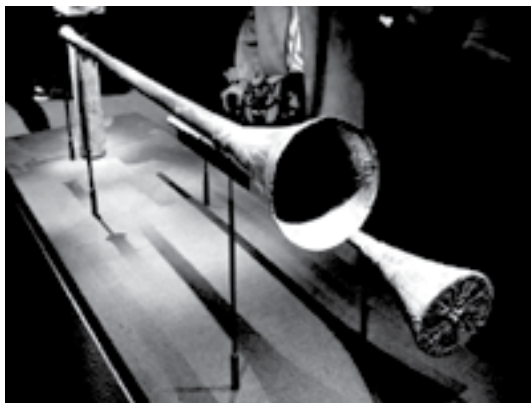
Ілюстрація 1. Срібна труба та її сурдина 1

Згадана сурдина є найбільш розповсюдженим різновидом цього пристрою, що отримав назву “ straight ”.