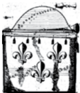
Ілюстрація 4. Малюнок труби та сурдини до неї з трактату М. Мерсенна