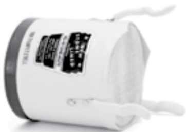
Ілюстрація 14. «Bucket mute»

Зовнішній вигляд сурдини «Derby (hat)» нагадує звичайний капелюх (Іл. 15). Раніше такі сурдини найчастіше виготовлялися із металу (зазвичай алюмінію), а зараз переважає пластик. Це унікальний тип сурдини, що може використовуватися як «plunger» (триматися рукою) або стояти перед музикантом на стійці. Другий варіант дає можливість видозміни лише декількох нот без відволікання на встановлення сурдини в розтруб і, водночас, дає змогу повноцінно тримати інструмент. Велика глибина сурдини вказує на те, що тембр інструмента майже не змінюється, лише приглушується. Вілбур Депеніс (Deparis) майстерно використовує таку сурдину у своїх соло разом із власним бендом «New» з Нового Орлеану.