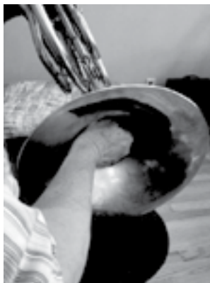
Ілюстрація 12. Приклад застосування техніки «stopping»

Це той самий вид техніки, що був розроблений А. Гампелем в середині XVIII століття. На письмі позначається: «+», «stopped», «stopfen» або «echo». Цей прийом використав Поль Дюка у «Вілланелі» для валторни з фортепіано.