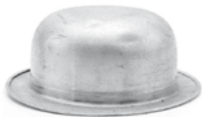
Ілюстрація 15. «Derby hat»