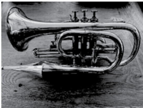
Ілюстрація 7. Ехо-корнет фірми С. G. Conn 13

За тривалий період еволюції змінилося не лише застосування сурдин у виконавській практиці, але й самі різновиди цього пристрою. Найдавнішим і найпростішим у виготовленні був вид сурдин «Straight Mute» (Іл. 8). Сурдина фіксується в інструменті за допомогою трьох корків, розміщених на її «хвості». Сьогодні найчастіше виготовляється з металу, рідше – з пластмаси чи дерева, завдяки їй звук перетворюється на темний, глухий. Цей різновид сурдини найчастіше зустрічається в класичній академічній музиці, зокрема, його застосовано в «Концерті» Бели Бартока для симфонічного оркестру для групи труб.