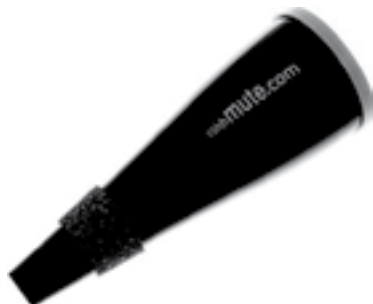
Ілюстрація 16. «Whisper (practice mute)»

Також існують подібні електронні сурдини «silent brass», які є підвидом сурдини «whisper». Але завдяки електронному преампу і навушникам музикант почувається набагато краще, ніж при грі на сурдині «practice». Проте залишається проблема з надмірним опором, що ускладнює регулярні заняття з такими сурдинами.