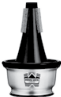
Ілюстрація 9. «Cup Mute»