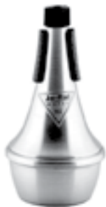
Ілюстрація 8. «Straight Mute»