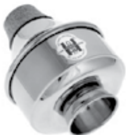
Ілюстрація 10. «Harmon Wa-Wa Mute»

Сурдина типу «Harmon Wa-Wa Mute» (Іл. 10) фіксується в інструменті завдяки суцільному корку, розміщеному на початку її хвоста. Зміна конструкції фіксатора сурдини зумовлена необхідністю повного контролю руху струменя повітря. Пристрій складається з двох елементів – «тіла» сурдини та чашоподібної частини на ніжці, яка знімається і утворює притаманний лише цій сурдині «квакаючий» звук. Завдяки маніпуляціям правої руки музикант досягає зникаючого чи наростаючого ефекту гучності або «квакаючого» звучання. Це дуже популярний вид сурдин, особливо в джазовій музиці. Іронічний світлий звук допомагає створити веселий та невимушений настрій виконуваної композиції. Сурдини саме цього типу використовуються трубачами в «Рапсодії у блюзових тонах» Дж. Гершвіна, а відомий американський трубач Майлз Девіс (Davis, 1926–1991) часто застосовував «квакаючий» ефект без з'ємної частини, що створювало приглушений проникливий тембр.