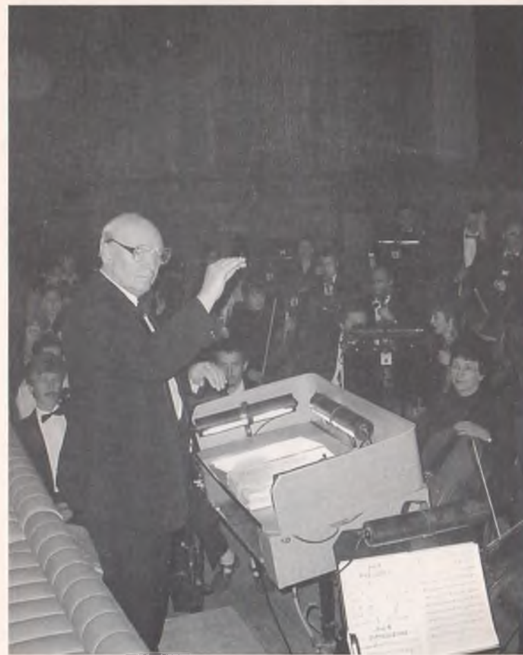
Під час вистави "Ріголетто" Дж. Верді в ХАТОБі (2003 р.)