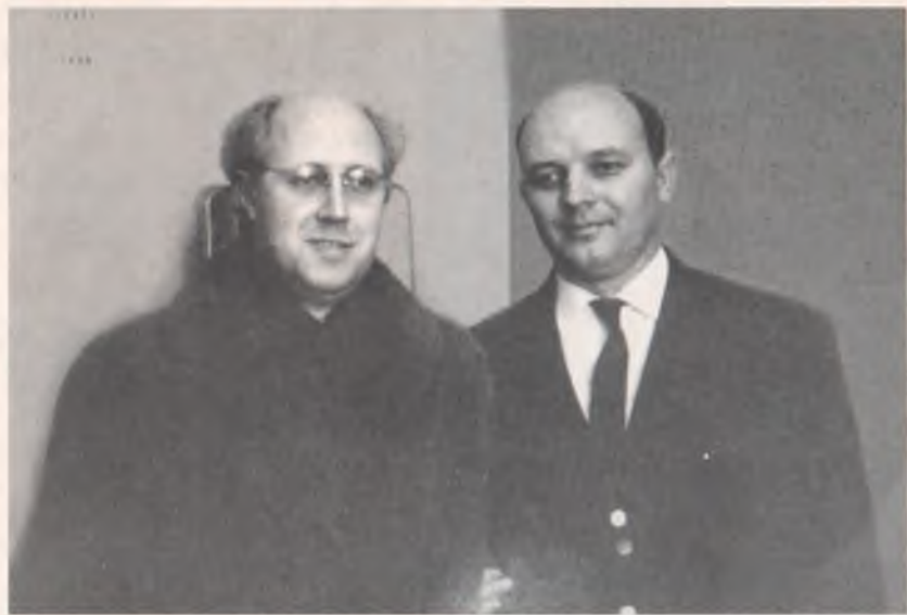
М. Ростропович та А. Калабухін після спільного концерту в Харківській філармонії (1972 р.)