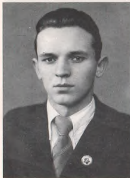
Студент харківської державної консерваторії (1950)