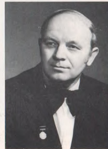
Народний артист України А. Калабухін (1985 р.)