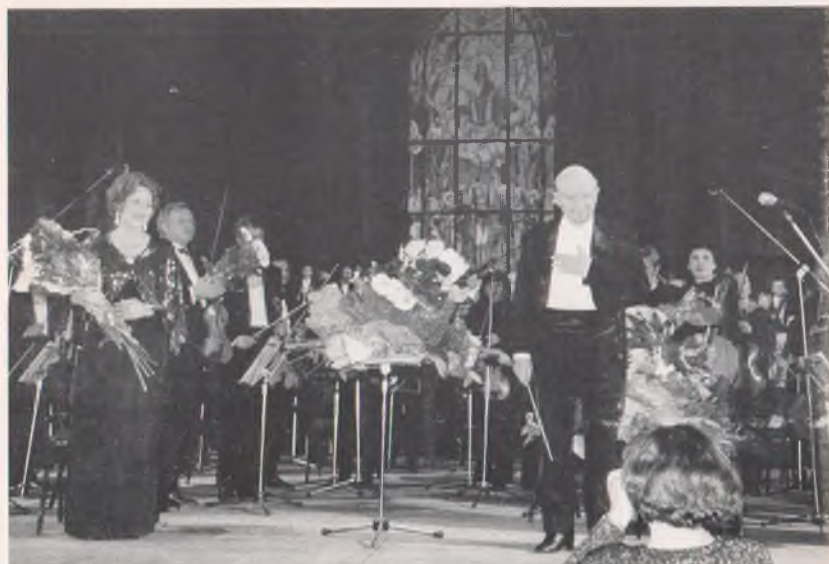
Після виконання "Реквієма" Дж. Верді (2003 р.)