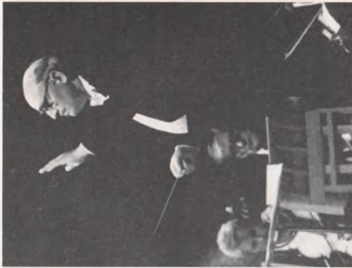
Під час концерту з оркестром в Харківській філармонії (1988 р.)