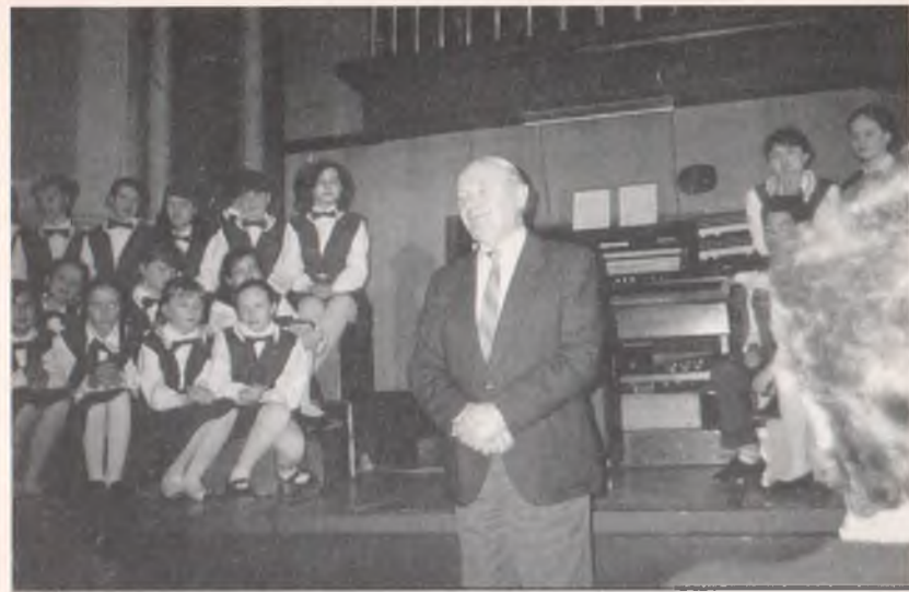
Поздоровлення хора «Скворушка» Харківського палацу дитячого та юнацького творчества з 30-річним ювілеєм