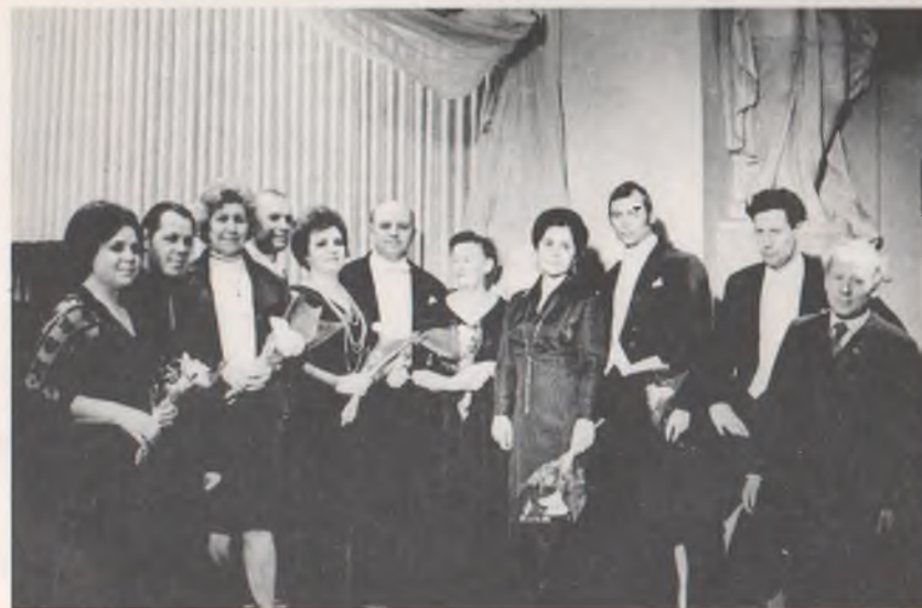
Прем'єра опери "Алеко" в Харківській обласній філармонії. 1 квітня 1973 р. (ювілей С. Рахманінова)