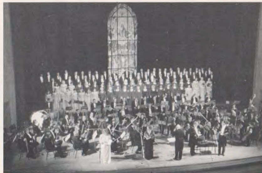
Під час виконання "Реквієма" Дж. Верді (2003 р.)