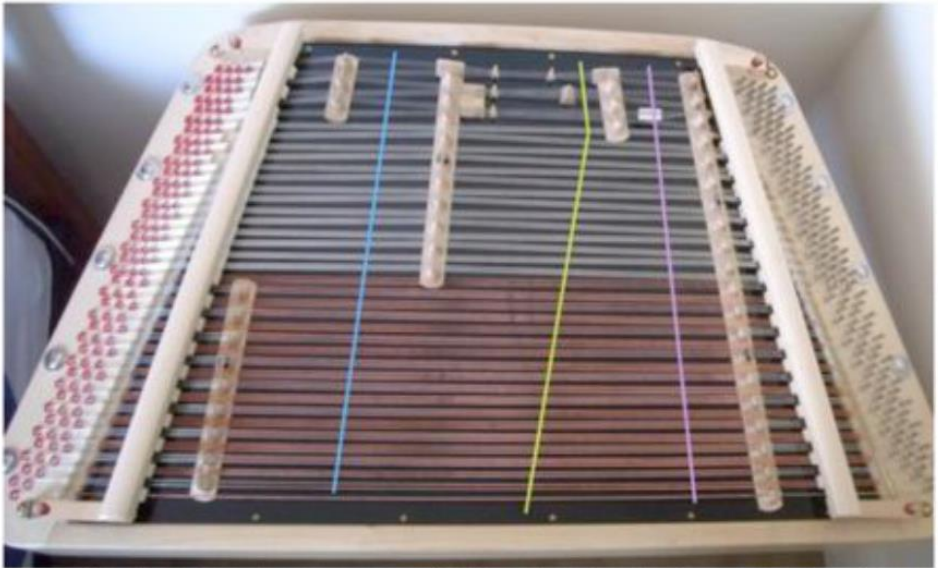
Рисунок 1. Дж. Вебстер. Візуальна презентація деяких з напрямів glissandi на струнах цимбалів / visual representation of some possible glissandi from the manual (Webster, 2013: 92), концертні цимбали Павла Вишнянського

The blue glissando sounds most of the left-most strings, the green glissando sounds all of the central strings, most of the right-most steel strings and all of the copper-wound strings, and the purple glissando sounds all the rightmost strings.