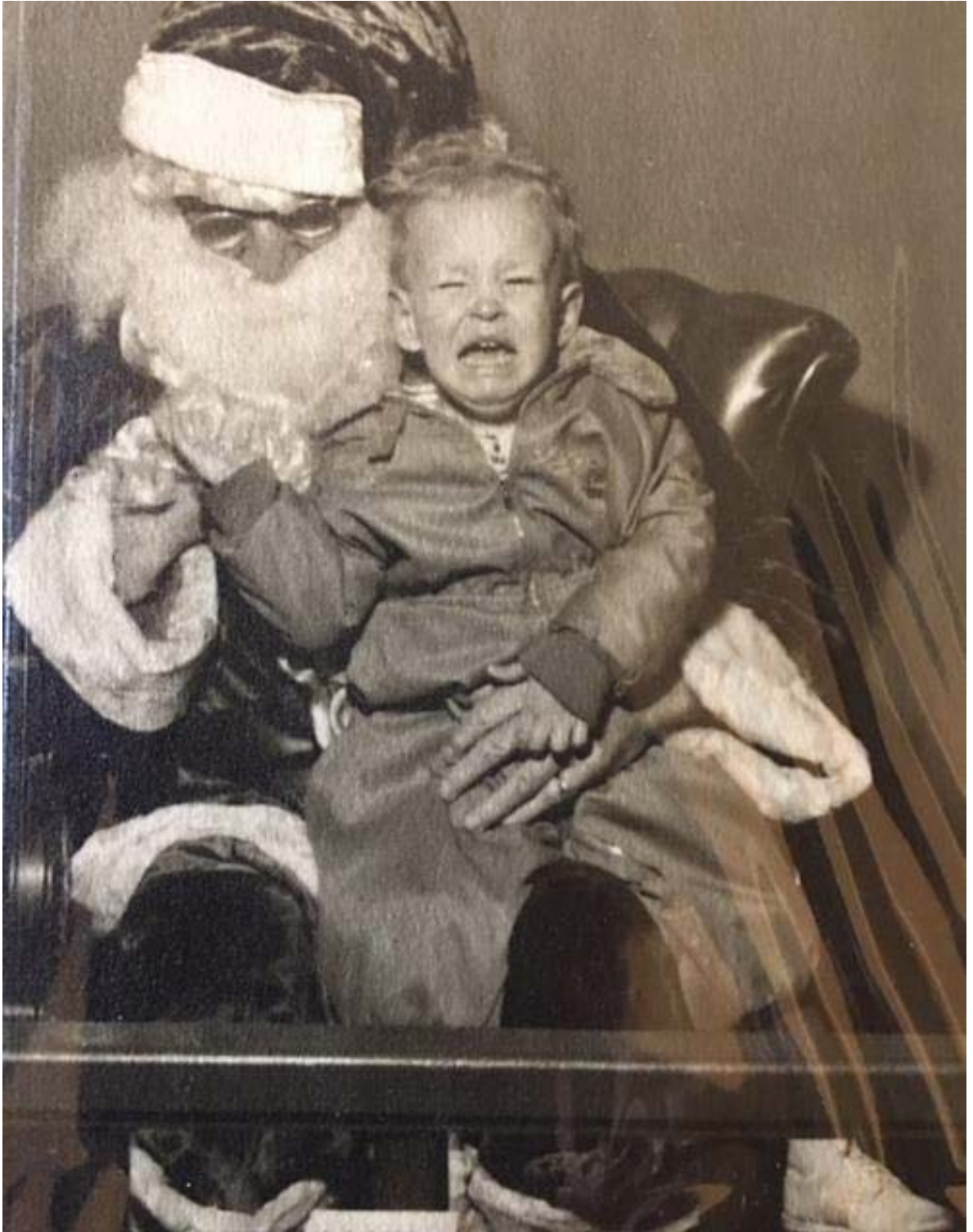
Фото 7. Перша світлина юного композитора у Halle's Department Store (1956 р., Клівленд, Огайо)