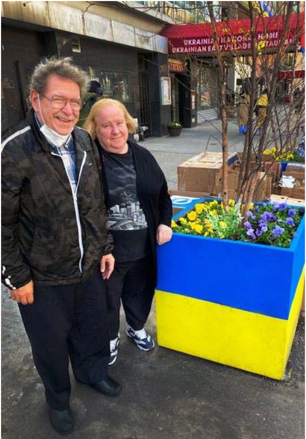
Фото 10. Композитор біля The Ukrainian East Village Restaurant (квітень 2022 р., Нью-Йорк)