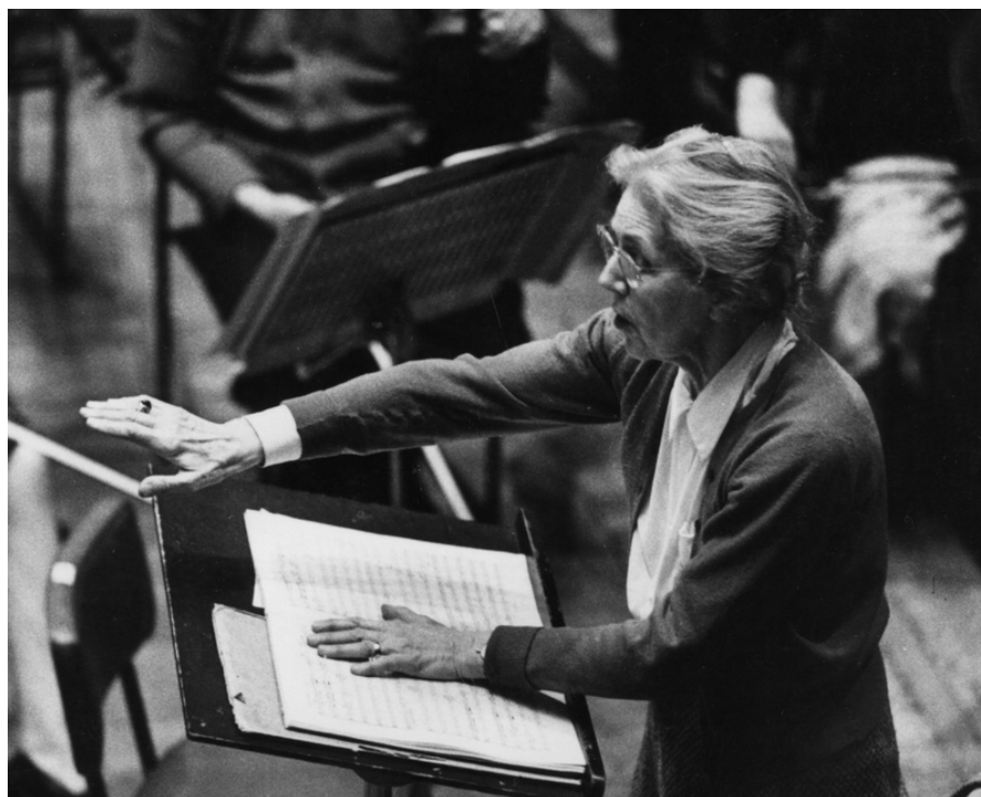
Фото 4. Надя Буланже за диригентським пультом