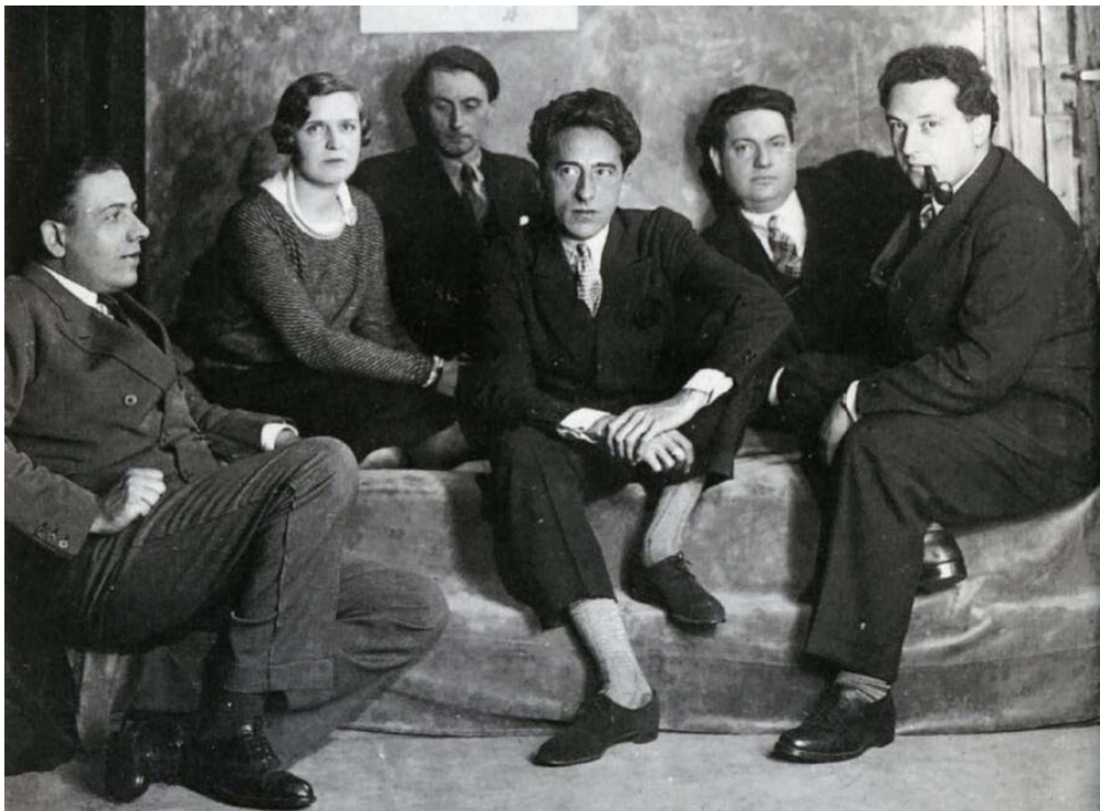
Фото 1. «Шістка» (зліва направо: Ф. Пуленк, Ж. Тайфер, Ж. Орік, Л. Дюрей, Д. Мійо, А. Онеггер)