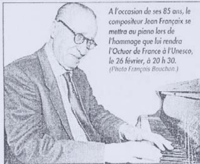
A l'occasion de ses 85 ans, le compositeur Jean Françaix se mettra au piano lors de l'hommage que lui rendra l'Octuor de France à l'Unesco, le 26 février, à 20 h 30.