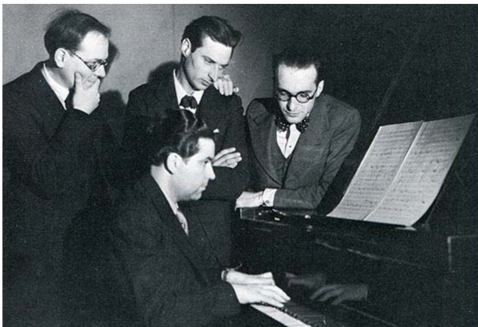
Фото 2. «Молода Франція» (зліва на право: О. Мессіан, І. Бодріє, Д. Лесюр, за фортепіано А. Жоліве)