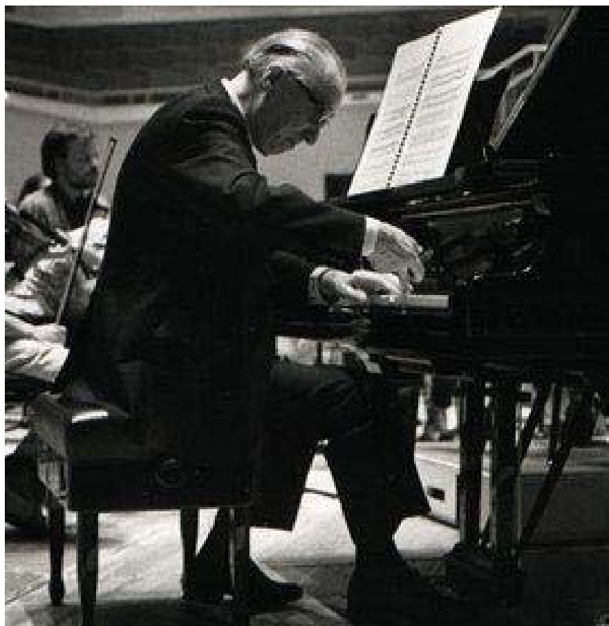
Фото 3. Жан Франсе грає на роялі