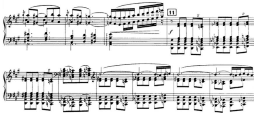
Приклад 8. К. Дебюссі. Рапсодія для оркестру та саксофону

Реприза умовної побічної теми (ц. 11) починається в субдомінантовій сфері (див. Приклад 8)