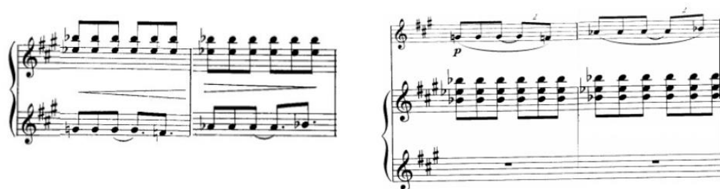
Приклад 9. Порівняння редакторських версій Дюрана та В. Давіда.

Популярною серед виконавців є версія французького саксофоніста, композитора та диригента Вінсента Давіда (видавництво Editions Henry Lemoine, Париж, 2001). французький саксофоніст, професор Паризької вищої національної консерваторії музики та танцю Клод Делангль (нар. 1957) у 1999 році записав редакторську версію В. Давіда (диск «A Saxophone for Lady», партія фортепіано – Оділь Делангль) 5 . Редакційний варіант В. Давіда стосується, перш за все, переміщення тематичного матеріалу з фортепіанної фактури у партію саксофону, що продиктовано бажанням демонструвати найкращі виразові можливості саксофону. Наведемо приклад (див. приклад 9)